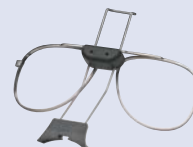
3M™ 6878 Kit acoplamiento gafas para máscaras completas Serie 6000