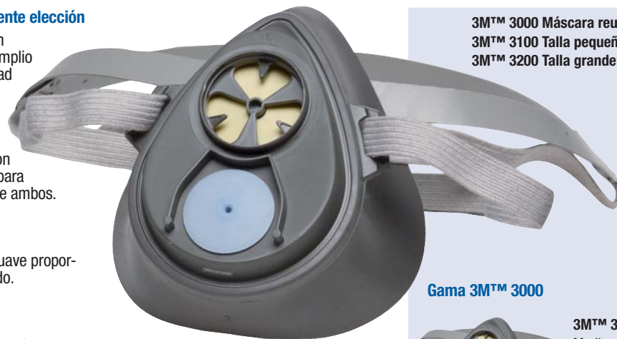
3M™ 3000 Máscara reutilizable 3M™ 3100 Talla pequeña (gris claro) 3M™ 3200 Talla grande (gris oscuro)

**El filtro 3M™ 7725 sólo se puede utilizar junto con el filtro 3351 con retenedor 774.