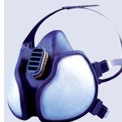
3M™ 4251 Máscara autofiltrante Vapores orgánicos y partículas FFA1P2D