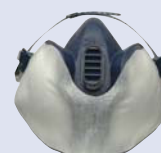
Protector del filtro 3M™ 400 (adecuado para aplicaciones en spray)