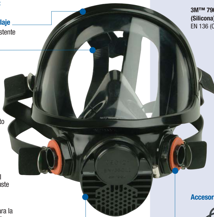
3M™ 7907S Máscara completa reutilizable (Silicona). EN 136 (Clase 2)