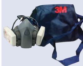
3M™ 106 Bolsa para media máscara