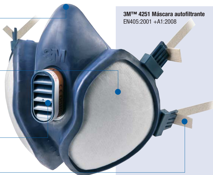
3M™ 4251 Máscara autofiltrante EN405:2001 +A1:2008