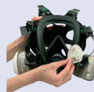
3M™ 105 Toallita limpiadora facial