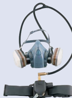
3M™ S-200 Suministro de aire EN139:1994 NPF=50 con media máscara. NPF=200 con máscara completa.