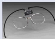
3M™ 7925 Kit acoplamiento gafas para máscara completa 7907S