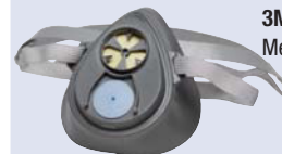
3M™ 3200/3M™ 3100 Media máscara